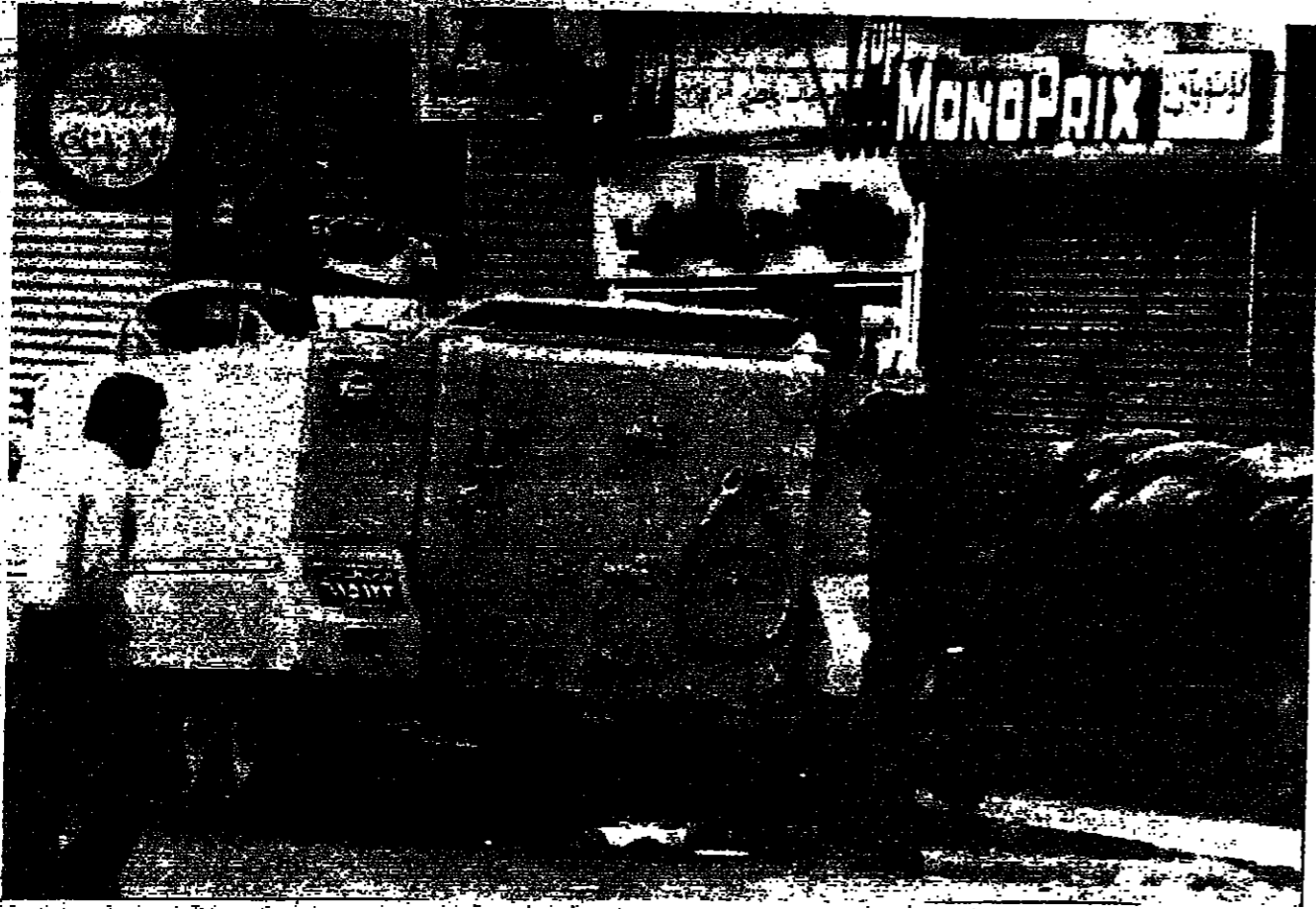
متراس تركه المسجونون وحملتهم رجال الامن في ساحة رياض الصالح